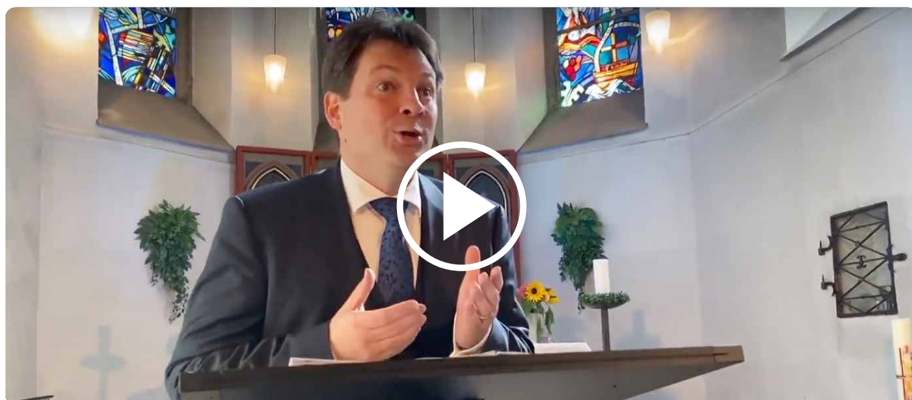
WILLIAM LAWES White though ye be